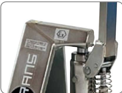
Die ex-geschützten Geräte sind für die Pharmaindustrie, sowie die Farben-, Öl- und Gasindustrie gut geeignet.