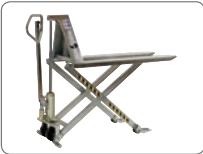
Die Standard-Geräte sind manuell und aus rostfreiem Stahl hergestellt.