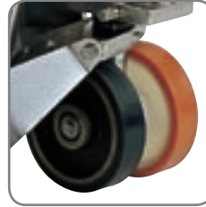
Die Geräte haben mindestens ein geprüftes, antistatisches Vulkollan-Rad, um elektrostatische Aufladung zu vermeiden.