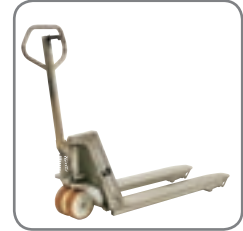
Die robuste Konstruktion garantiert eine lange Lebensdauer und niedrige Wartungskosten.