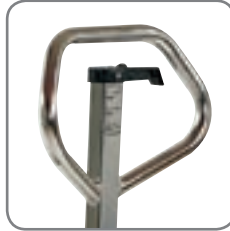
Die ergonomische Deichsel gewährt dem Anwender einen entspannten Griff.

Die Geräte entsprechen der Gerätegruppe II und sind für Bereiche zugelassen, die als Zone 1/Zone 21 klassifiziert sind (umfassen auch Zone 2/Zone 22). Das heißt Bereiche, in denen zu rechnen ist, dass eine gefährliche, explosionsfähige Atmosphäre durch ein Gemisch aus Gasen oder durch Staub gelegentlich auftritt.