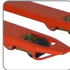
Gleitbügel an den Gabelspitzen ermöglichen ein einfaches und leichtes Hinein- und Herausfahren aus Paletten.