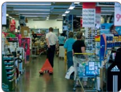
Panther Silent in einem Supermarkt, wo Komfort und Wohlbefinden der Kunden von großer Bedeutung sind.