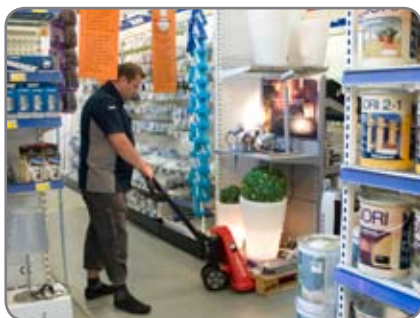
Auch in sehr schmalen Gängen können Güter problemlos transportiert werden.