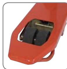
Die Zwillingsgabelrollen sichern optimale Drehbewegungen.