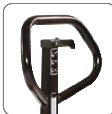
Die ergonomische Deichsel gewährt einen entspannten Griff.