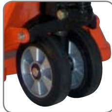
Spezielle schonende Gummiräder bedeuten minimum Verschleiß und keine Zerstörung von z.B. Fliesenbelägen.