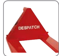
Firmennamen bzw. Logo des Kunden können im Dreieck des Wagens ausgeschnitten werden.