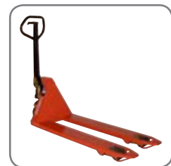
Panther Silent hat permanenten Schnellhub.

Gerne bieten wir Ihnen auch kundenspezifische Lösungen an. Besuchen Sie auch www.logitrans.com .