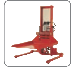
Als Zubehör werden Dorn-, Plattform-, Rollen- und Fasskipper angeboten.