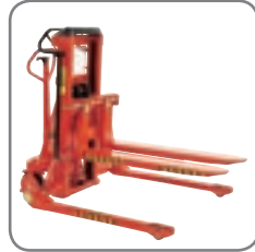
Die Gabeln lassen sich an allen Logiflex-Modellen mit oder ohne Breitspurfahrwerk anbauen.

Robuste Konstruktion garantiert lange Lebensdauer/niedrige Wartungskosten.