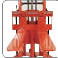
Gabelzinke U-Profil: Standardgabeln, die mit dem Logiflex geliefert werden.