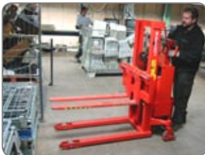
Die massiven Gabeln hier beim Recycling von elektronischen Komponenten.