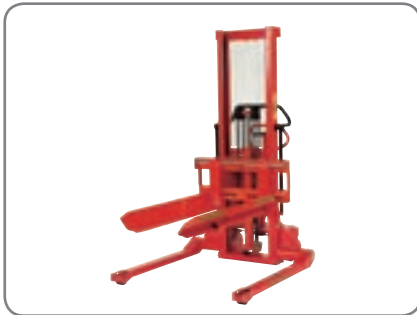
Fassgabeln - eine gute Alternative, wenn liegende Fässer zu heben und transportieren sind (nicht mit Schnellwechsel-System).