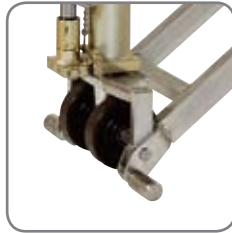
Optimale Sicherheit: Stützen in Nähe der Lenkräder und zentrale Platzierung aller Bedienungsfunktionen auf der Deichsel.