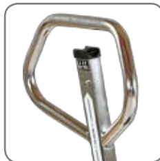
Ergonomische Deichsel sorgt für einen entspannten Griff.