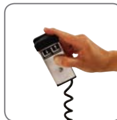
Eine Fernbedienung ist als Zubehör erhältlich (EHL).