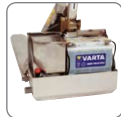
Wasserfeste Kapselung des Hubmotors (EHL RF-PLUS).

Bitte fordern Sie Werkstoff-Spezifikationen und kundenspezifische Lösungen an. Besuchen Sie auch www.logitrans.com .