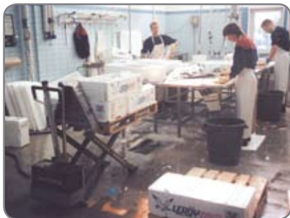
RF-SEMI - für die Lebensmittelindustrie in den Gebieten, wo Korrosionsbeständigkeit wichtig ist.