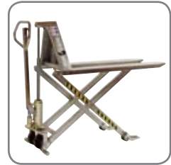
Der manuelle Scherenhubwagen ist auch in explosionsgeschützter Ausführung erhältlich.