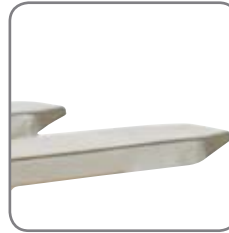
Geschlossene Gabel bedeutet einfache Reinigung und wenige Bakterienverstecke.