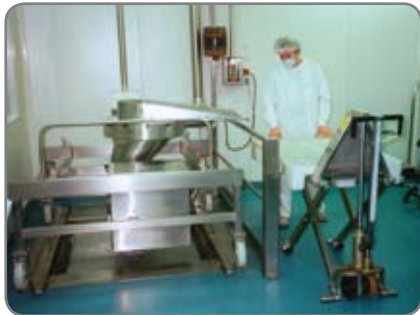
RF-PLUS - für die Lebensmittel- und Pharmaindustrie mit hohen Ansprüchen an Hygiene und Reinigung.