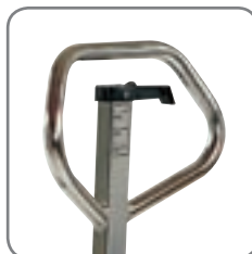
Ergonomische Deichsel sorgt für einen entspannten Griff.