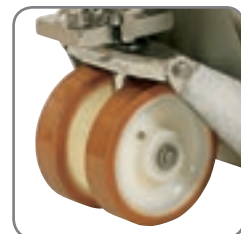
Radlager mit Gummidichtung.

Bitte fordern Sie Werkstoff-Spezifikationen und kundenspezifische Lösungen an. Besuchen Sie auch www.logitrans.com .