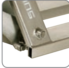
2-seitig offene oder völlig geschlossene Hohlräume ermöglichen eine effektive Reinigung.