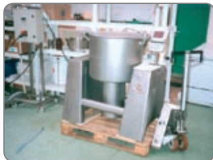
RF-PLUS - für die Lebensmittel- und Pharmaindustrie mit hohen Ansprüchen an Hygiene und Reinigung.

* Löcher in den Gabeln für den Radhalter.