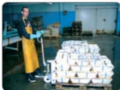
RF-SEMI - für die Lebensmittelindustrie in den Gebieten, wo Korrosionsbeständigkeit wichtig ist.