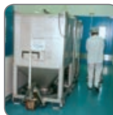
Der RF-PLUS Gabelhubwagen hier in der Pharmaindustrie.