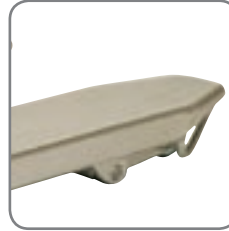
Geschlossene Gabel bedeutet einfache Reinigung und wenige Bakterienverstecke.