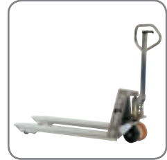
Der Gabelhubwagen ist auch in explosionsgeschützter Ausführung erhältlich.