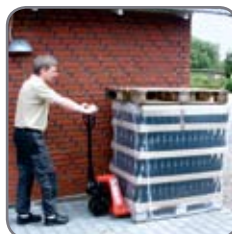
Basic hier beim Handling von Bierflaschen.