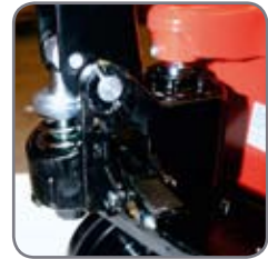
Zuverlässiges, Öl dichtes Hydrauliksystem.