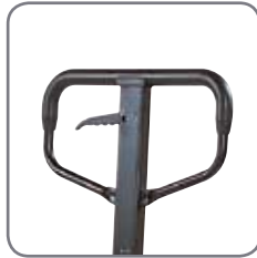
Kunststoffbeschichtung der Deichsel sorgt für einen angenehmen Griff.