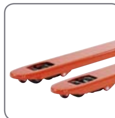
Mit Single- oder Tandem-Gabelrollen erhältlich.