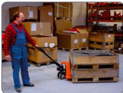
Basic hier beim Einsatz in der Komponentenfertigung.