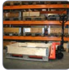
Basic hier beim Handling von schweren Gütern der Komponentenfertigung.