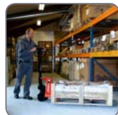
Basic hier beim Einsatz in einem Lager.

Fragen Sie bitte nach weiteren Informationen. Besuchen Sie auch www.logitrans.com .