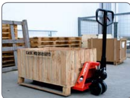
Basic hier beim Einsatz in der Verpackungsindustrie.